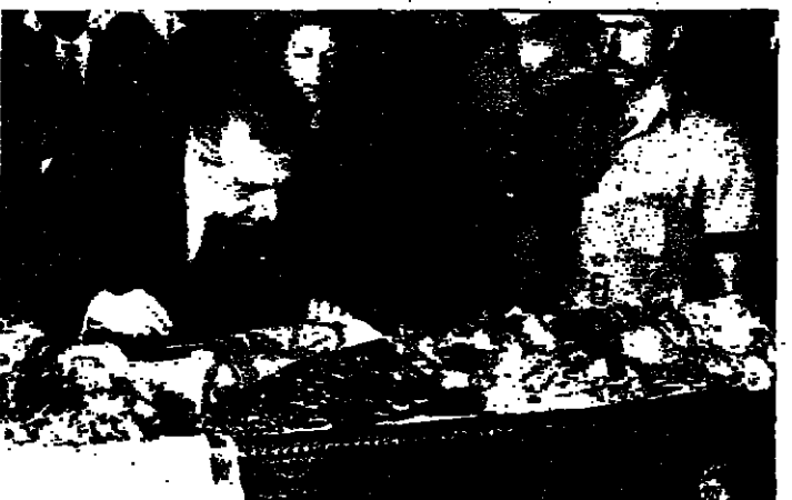
سفيان سباعي وزير الخارجية السورية في استقبال الرئيس القبرصي بالوكالة مكاريوس